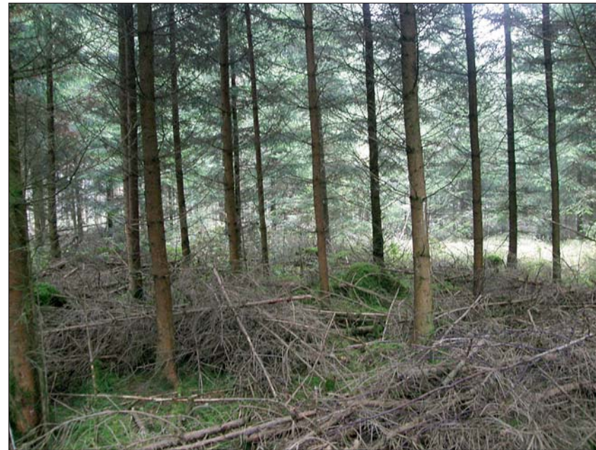
Dieser Bestand wurde 2005 (Höhe 7 bis 8 m und BHD 7 cm) auf 2500 Bäume/ha reduziert, was für diese Pflegemaßnahme eigentlich zwei bis drei Jahre zu spät war. Im Bild zu sehen ist der Bestand im Jahr 2010 – fünf Jahre nach der Stammzahlreduktion: Der Bestand weist inzwischen eine Höhe von 13 m und einen BHD von durchschnittlich 14 cm auf.

Wenn die Zuwachsbäume in einem Abstand von 5 bis 6 m (also 300 bis 400 Stück/ha!) ausgewählt werden, kann das marktoptimale Produktionsziel, nämlich so genanntes „Mittelholz“ mit einem BHD von 40 bis 45 cm, bereits nach 40 bis 60 Jahren erreicht werden. Dabei hängt die Anzahl ausgewählter Z-Bäume von der Bonität des Bestandes ab: Je schlechter, umso weiter der Baumabstand und umso geringer die Zahl der Z-Bäume. Wenn die Zukunftsbäume dauerhaft markiert werden, sind erhebliche Zeitersparnisse bei der Bestandesvorbereitung realisierbar.