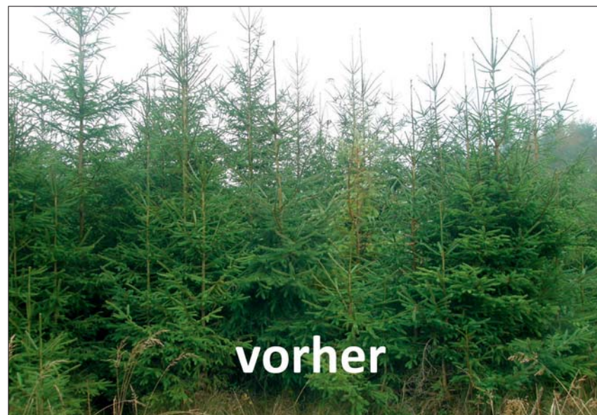
Jungwuchspflege im Fichten-Mischbestand (Höhe 1,5 bis 4 m): Reduktion auf 2500 Stück/ha

namischen Natur. Deswegen ist untrennbar mit dem Begriff des Unternehmers die Rolle des Risikos verbunden. Verantwortungsträger, die weder persönlich, noch aufgrund der Unmöglichkeit des marktbedingten Untergangs ihrer Betriebseinheit, ein existenzielles Risiko tragen, können nicht Unternehmer genannt werden. Deswegen findet sich genau hier – wie auch an der Fragestellung der Sterblichkeit der Betriebseinheit – die definitorische Trennlinie zwischen privaten Forstunternehmen